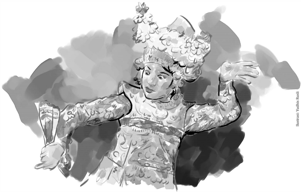
Ilustrasi: Yudhis Rusli

salib-Nya, atau lagu “Kumasuki gerbang-Nya” dapat ditarikan dengan gerakan sedikit cepat dan ekspresi sukacita di dalam Tuhan.